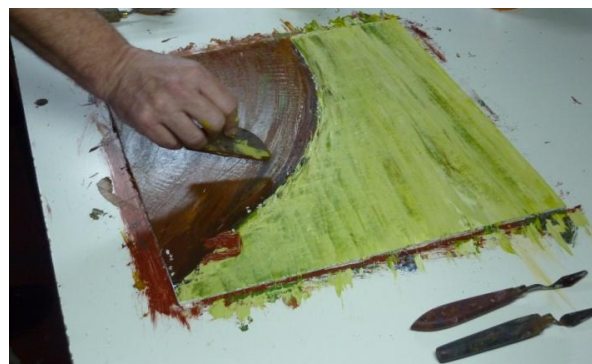
Figura 4: Imagen tomada durante la realización de “CHAGAS. Reconocer miradas, sumar voces, acortar distancias...” (Córdoba, septiembre de 2010).

La propuesta aborda generalidades de la problemática desde una mirada integral, utilizando como soporte visual un video ilustración que muestra el proceso creativo de la realización de 5 imágenes en acrílico que ilustran los ejes temáticos del texto (Figura 4). En el proceso mismo de su realización se buscó dar lugar a la pluralidad de actores implicados con lo que el texto, la estructura, la imagen y el sonido (tanto de la música como de la voz) se conjugaron reflejando las particulares interpretaciones y sentires de los participantes para dar lugar a una obra colectiva con identidad propia.