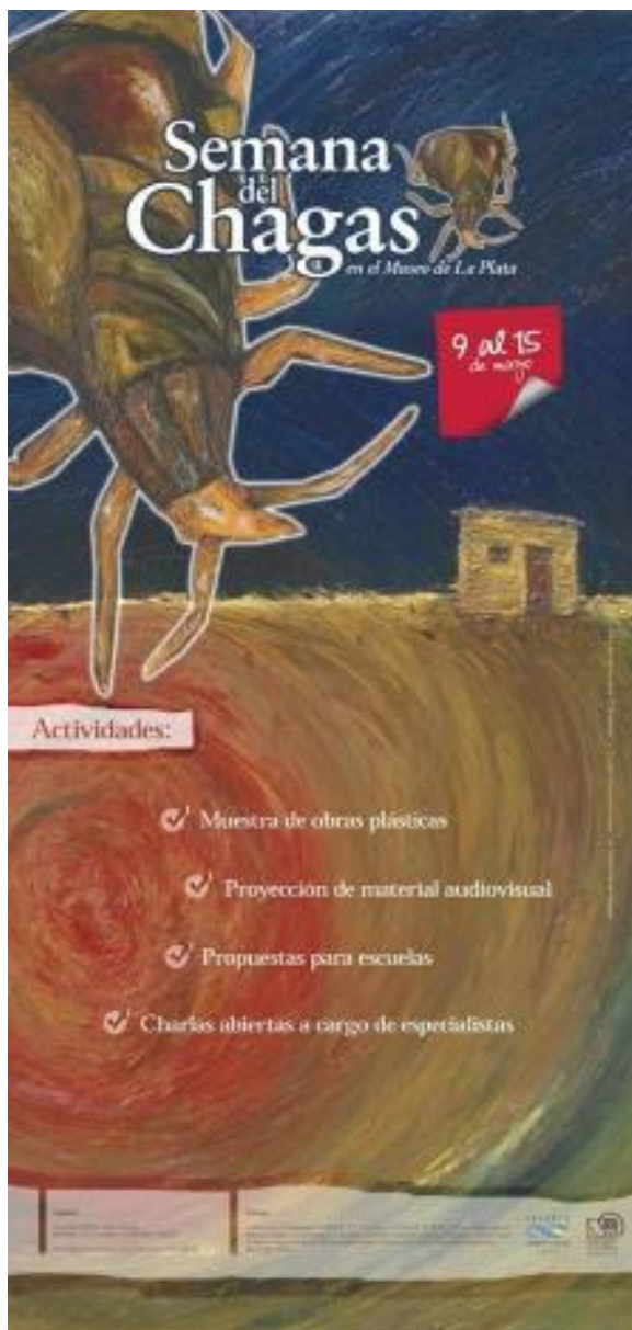
Figura 3: Banner de difusión de la Semana del Chagas en el Museo de La Plata (La Plata, mayo de 2011).

acordes a las características de los escenarios actuales (urbano y global, además de rural y latinoamericano). En este sentido, y para modificar la gran distancia que separa al “universo” de la producción científica, de las poblaciones afectadas, es necesario apuntar al desarrollo de estrategias y acciones que no estén orientadas sólo a evitar la enfermedad, sino a la promoción de la salud de las personas. A partir de estas consideraciones elaboramos “CHAGAS. Reconocer miradas, sumar voces,